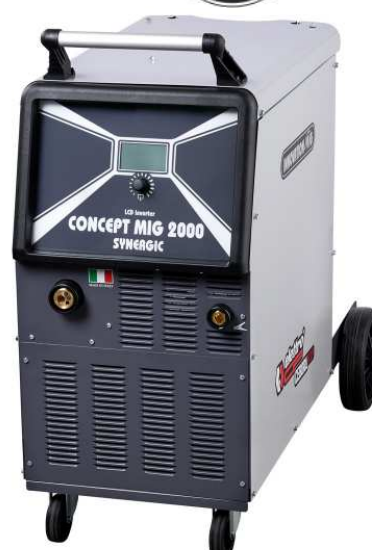
CONCEPT MIG 2000