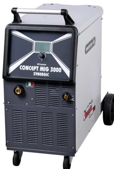
CONCEPT MIG 3000