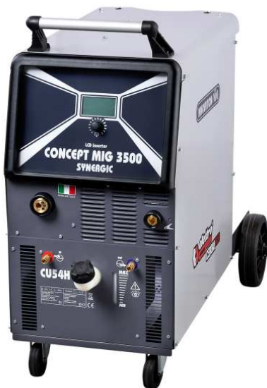
CONCEPT MIG 3500