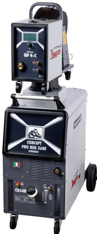
CONCEPT PRO MIG 3600